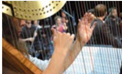
Ensemble Ulysses