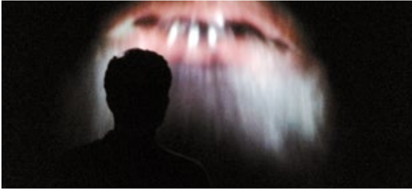
Mon corps parle tout seul

Installation à voir avant ou après Les Aveugles p.5 et avant Rebonds et artifices p.4