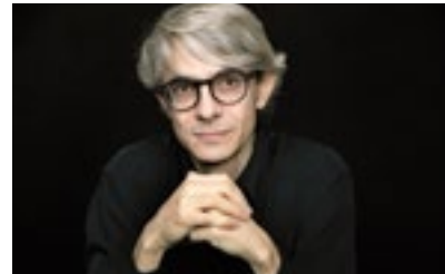
Alberto Posadas