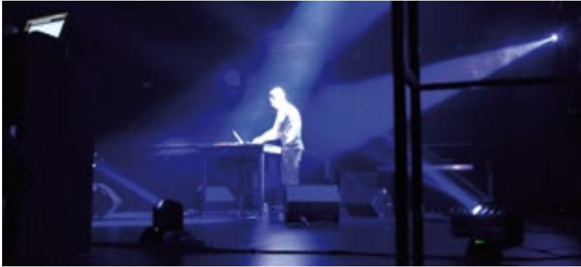
Ircam Live 2015

MERCREDI 7 MARS, 20H30 CENTRE POMPIDOU, GRANDE SALLE