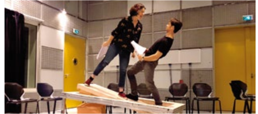
Répétitions à l'Ircam