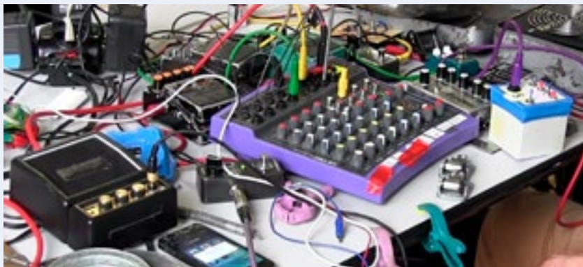
Dispositif de jeu d'Arnaud Rivière

MERCREDI 8 ET JEUDI 9 NOVEMBRE, 9H-18H30 MUSÉE DU QUAI BRANLY - JACQUES CHIRAC