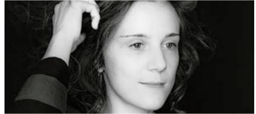
Clio Simon © Ulysse del Drago - Festival du nouveau cinéma

Coproduction Ircam/Les Spectacles vivants-Centre Pompidou, Festival Archipel (Genève)