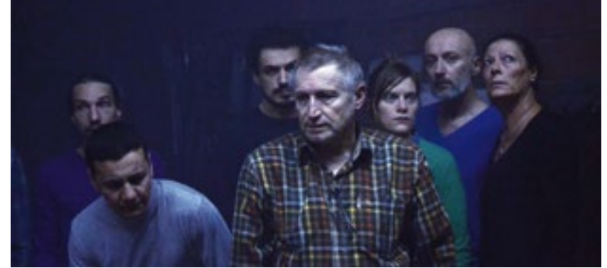
Les Aveugles © Daniel Jeanneteau

Coproduction Ircam-Centre Pompidou, T2G - Théâtre de Gennevilliers, Ensemble intercontemporain. Avec le soutien d'Impuls neue Musik, Fonds franco-allemand pour la musique contemporaine.