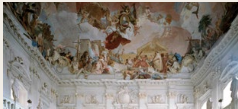
Résidence de Würzburg, architecte Balthasar Neumann © akg-images / Bildarchiv Monheim

Coproduction Musée du quai Branly - Jacques Chirac, Ircam-Centre Pompidou. Avec le soutien du Labex Création, Arts, Patrimoines.