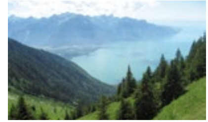
Lac Léman