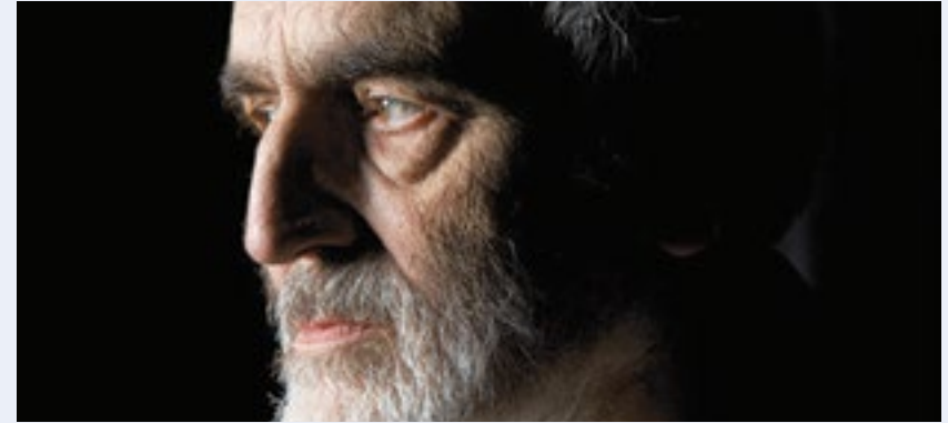
Helmut Lachenmann

Production déléguée Association Poppydog. Coproduction Le Quai, Centre dramatique national Angers Pays de la Loire ; CDN Orléans/Loiret/Centre ; manège – Scène Nationale – Reims ; Théâtre Garonne – Scène européenne (Toulouse) ; L'Arsecim, Centre d'Art scénique contemporain (Lausanne) ; Le Parvis, Scène nationale Tarbes-Pyrénées ; Ircam-Centre Pompidou ; Nanterre-Amandiers, Centre dramatique national ; Festival d'Automne à Paris. Coréalisation Nanterre-Amandiers, Centre dramatique national ; Festival d'Automne à Paris. Avec le soutien de King's Fountain. Avec l'aide du CNC Centre national de la danse (Pantlin), de La Villette – Résidence d'artistes 2016 et du Quartiz – Scène nationale de Brest. Dans le cadre du Festival d'Automne à Paris.