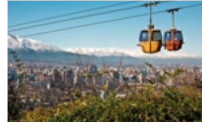
Santiago du Chili

NEW YORK / THE PARK AVENUE ARMORY 6, 7 OCTOBRE