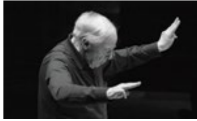
Pierre Boulez