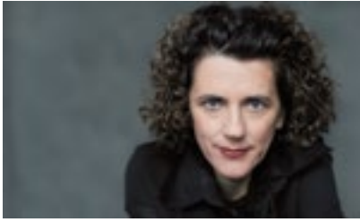
Olga Neuwirth